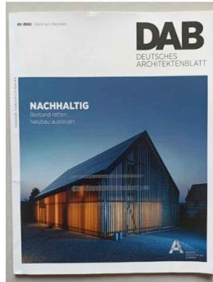
DAB 05.2022 Bestand retten, Neubau ausreizen